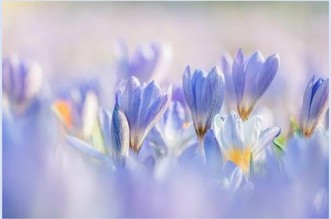
De lente is begonnen...